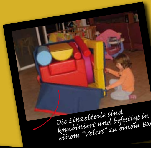
Die Einzelteile sind kombiniert und befestigt in einem "Velcro" zu einem Box

© Alle Rechte vorbehalten an Gili Litman Golan Für weitere Informationen: gililitm@zahav.net.il, +972 (0)50-2624169 www.GYMBOX.co.il