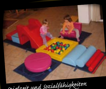
Spielzeit und Sozialfähigkeiten