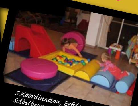
5. Koordination, Erfolgserlebnis and Selbstbewusstsein