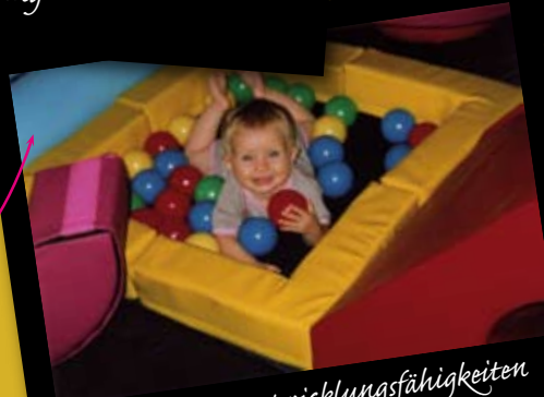
Förderung der Entwicklungsfähigkeiten durch Spiel und Spaß