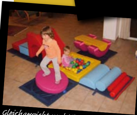
Gleichgewicht und Körperhaltung, Entwicklung der Grundkonzepte: Farbe, Entfernung