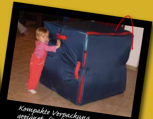
Kompakte Verpackung, geeignet für die Verwendung zu Hause