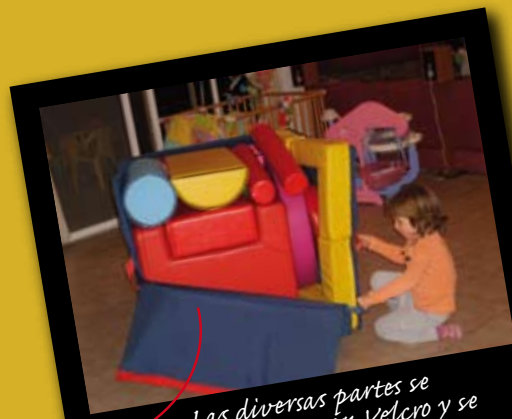
Las diversas partes se combinan con Velcro y se ajustan a la caja

© Todas reservaciones de derechos Gili Litman Golan Para la información adicional: gililim@zahav.net.il, +972 (0)50-2624169 www.GYMBOX.co.il