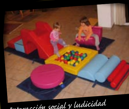
Interacción social y ludicidad