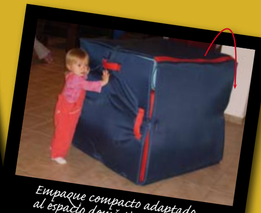
Empaque compacto adaptado al espacio doméstico