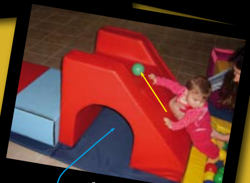
Incentiva el gateo y la coordinación del ojo con la mano