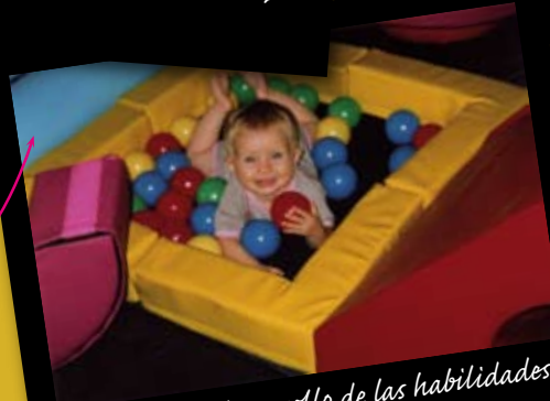
promueve el desarrollo de las habilidades mediante el juego y la diversión