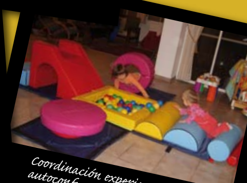
Coordinación, experiencia de logro y autoconfianza